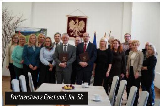
Partnerstwo z Czechami, fot. SK

Współpraca polsko-czeska obu gmin układa się pomyślnie od wielu lat. Już od 2016 roku Głuszyca i Rokytnice w Górach Orlic-