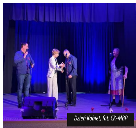
Dzień Kobiet