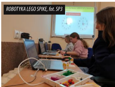
ROBOTYKA LEGO SPIKE

Lekcja robotyki Lego Spike była doskonałą okazją do tego, by zainteresować ósmoklasistów inżynierią i nowoczesnymi technologiami. Konstruowanie robotów potrafi