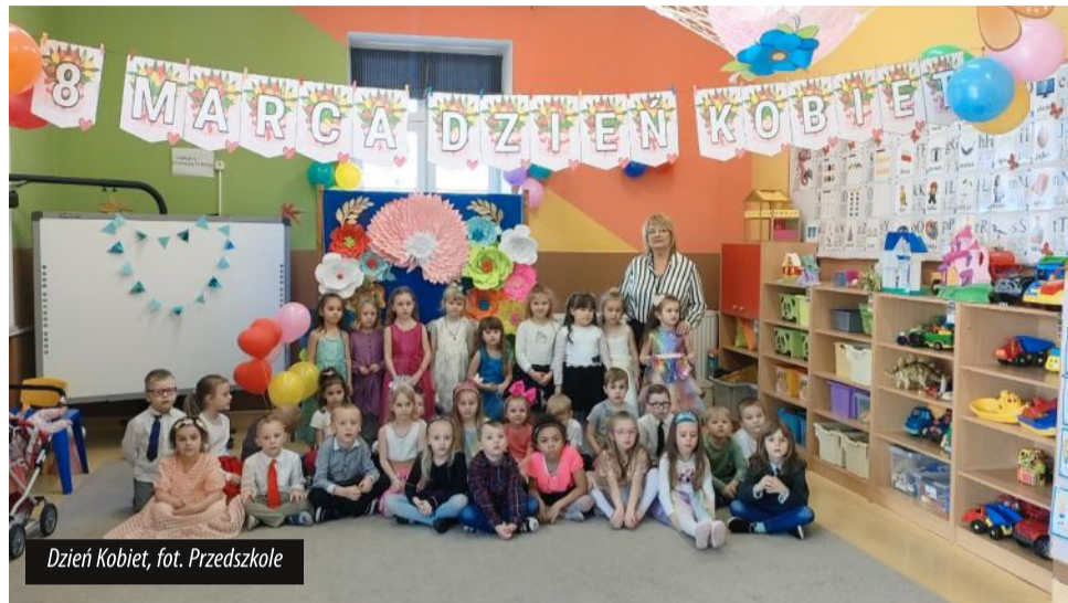
Dzień Kobiet