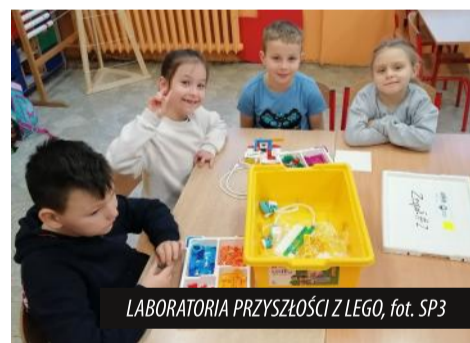
LABORATORIA PRZYSZŁOŚCI Z LEGO

skonstruowali, postępując zgodnie z instrukcją, Mechanicznego śmieciopotwora.