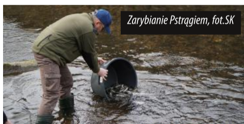
Zarybianie pstrągami

W ramach akcji zorganizowanej przez Polski Związek Wędkarski rzeka Bystrzyca została zarybiona młodym pstrągami od Zagórza aż po Bartnicę. Całe przedsięwzięcie to inwestycja na skalę 200 tysięcy złotych, z czego aż 60 tysięcy złotych zostało sfinansowane przez Wojewódzki Inspektorat Ochrony Środowiska. Celem jest odnowienie populacji pstrąga, co, jak się okazuje, nie jest łatwym zadaniem. Problemy takie jak nieuczciwe praktyki kłusowników znacznie utrudniają odbudowę tego cennego gatunku w naszych wodach. Z wypuszczonych kilku ton narybku, szacuje się, że tylko od 1% do 10% ryb zasiedli ostatecznie rzekę. Mimo to każdy krok ku odnowieniu naturalnej populacji pstrąga jest krokiem w dobrą stronę i wpisuje się w szeroko pojęte działania na rzecz ochrony środowiska i bioróżnorodności.