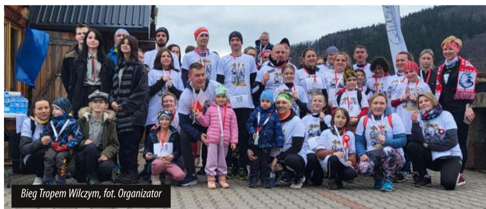
Bieg Tropem Wilczym

„Tropem Wilczym. Bieg Pamięci Żołnierzy Wyklętych” to ogólnopolskie wydarzenie, które upamiętnia bohaterów podziemia antykomunistycznego i antysowieckiego działającego w latach 1944-1963 oraz propagowanie wiedzy o historii współczesnej oraz aktywności rodzinnej. Od wielu lat wydarzenie organizowane jest przez Centrum Kultury-Miejską Bibliotekę Publiczną w partnerstwie z Gminą Głuszyca. Tak też i było w niedzielę 3 marca, kiedy na trasie pojawili się i starsi, i młodszy uczestnicy Biegu Tropem Wilczym w Głuszyca.