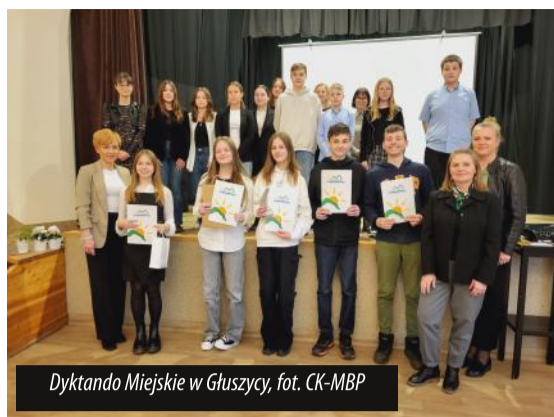
Dyktando Miejskie w Głuszyca