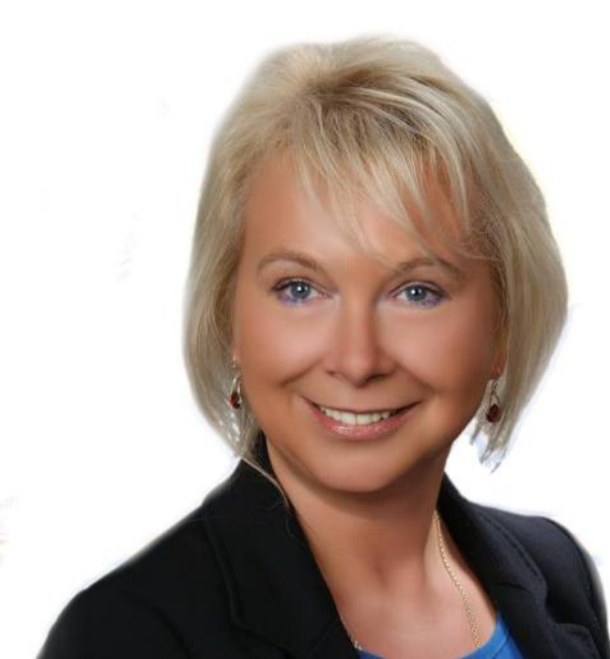
rowcą kategorii D.

KWR- Od 10 lat pracuję w głuszyckiej firmie, gdzie zajmuję się transportem i nieruchomościami. Z wykształcenia jestem socjologiem i magistrem zarządzania, a praca sprawiła, że stałam się elastyczna. Dzisiaj mogę sprzedawać dom czy mieszkanie, a jutro (jeżeli będzie taka potrzeba) wsiąść za kierownicę dużego autobusu i przewozić wycieczkę, ponieważ jestem również kie-